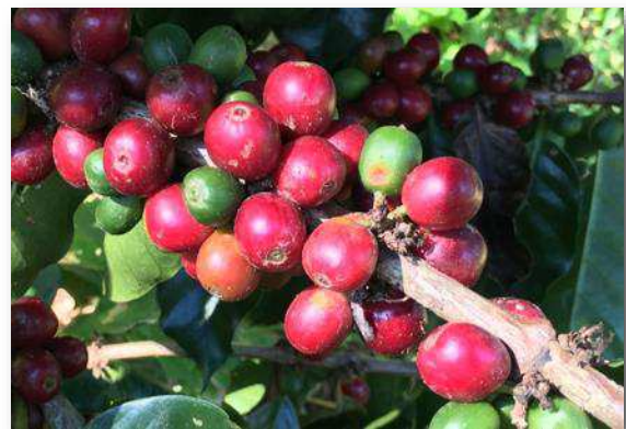
VIDEO #4: Café Bajo Sombra & Agroforestería