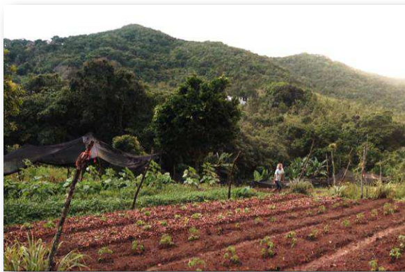
VIDEO #3: Permacultura, Conservación de Agua-Suelo