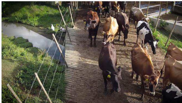
VIDEO #1: Ganadería Lechera

ADAPTA comunica las mejores prácticas de adaptación y mitigación disponibles para agricultores tropicales a través de videos y de hojas informativas educativas. ADAPTA documenta historias de productores en Puerto Rico que practican la conservación del suelo y el agua, el manejo integrado de plagas, la ganadería sostenible, la silvicultura, la agroecología, y otras buenas prácticas de conservación (i.e. labranza cero, abonos verdes, acolchado, manejo de residuos orgánicos, plantas cobertoras, rotación de cultivos) INFO: http://caribbeanclimatehub.org/proyecto-educativo-adapta/?lang=es