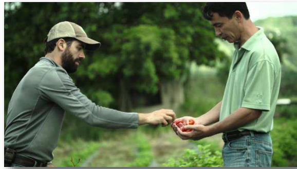
VIDEO #2: Plátanos & Hortalizas